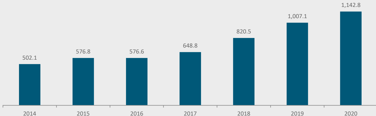
Chiapas Ingresos Anuales por Remesas Familiares (Millones de Dólares)

Comparando el 4° trimestre de 2020 con el trimestre anterior existe un aumento de 1.67 millones de dólares y en relación al 4° trimestre del año 2019, el aumento fue de 83.30 millones. En valores anuales, se observa un constante incremento del valor de las remesas.